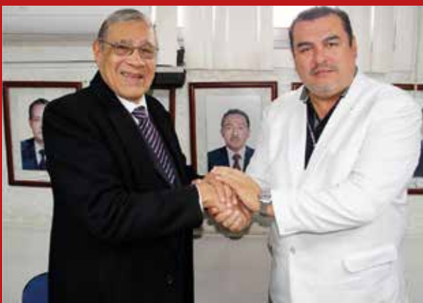
Facultad de Medicina Humana - USMP firma convenio con el Hospital San José del Callao para fortalecer la formación clínica de nuestros estudiantes.

El acuerdo tiene como propósito fortalecer la formación asistencial y de investigación de los estudiantes en pregrado e internado, y mejorar la calidad de vida de los pacientes.