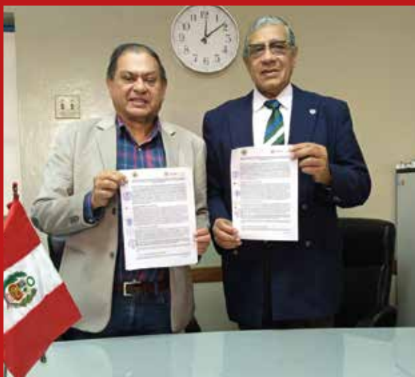
USMP Medicina firma convenio con Hospital Regional de Huacho: 3 años de formación e investigación.

El acuerdo, con una vigencia de tres años, tiene como meta fortalecer la formación académica y asistencial de nuestros estudiantes de pregrado e internado, permitiéndoles desarrollar sus competencias en un entorno de alta exigencia profesional.