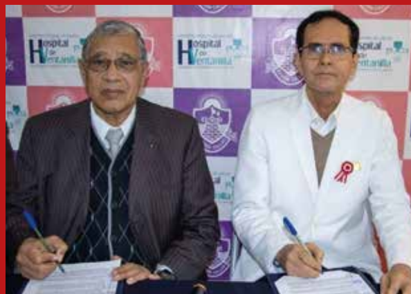
Facultad de Medicina Humana - USMP y Hospital de Ventanilla suscriben Convenio Específico de Cooperación Docente Asistencial.