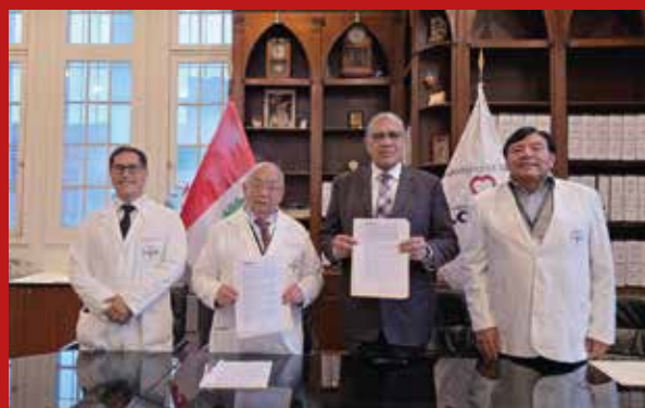
USMP Medicina firma convenio con el Hospital Nacional Arzobispo Loayza, en beneficio de los alumnos y de los pacientes.

La Facultad de Medicina Humana de la USMP reafirma así su compromiso con la excelencia en la formación médica, asegurando que sus estudiantes tengan acceso a experiencias prácticas de alto nivel en uno de los hospitales más prestigiosos del país.