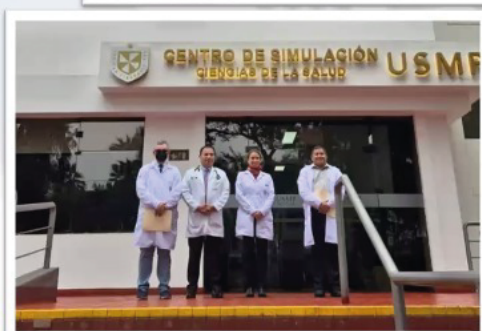
Centro de Simulación de Ciencias de la Salud