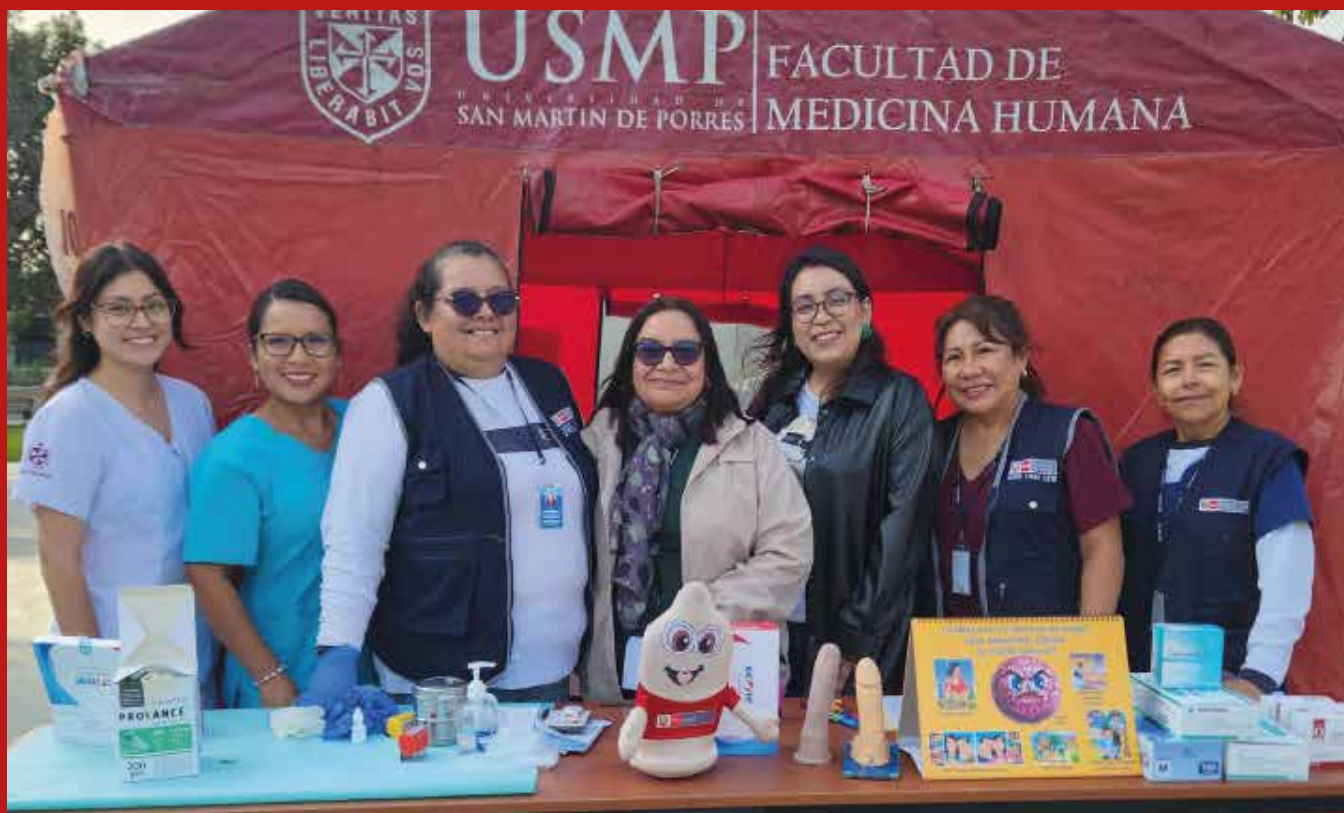
La Campaña se caracterizó por la participación de alumnos, docentes y empleados administrativos.

La Facultad de Medicina Humana, realizó, el pasado 24 de mayo, una campaña de Salud. La jornada tuvo como objetivo proteger la salud de nuestras autoridades, docentes, y empleados, frente a enfermedades inmunoprevenibles.