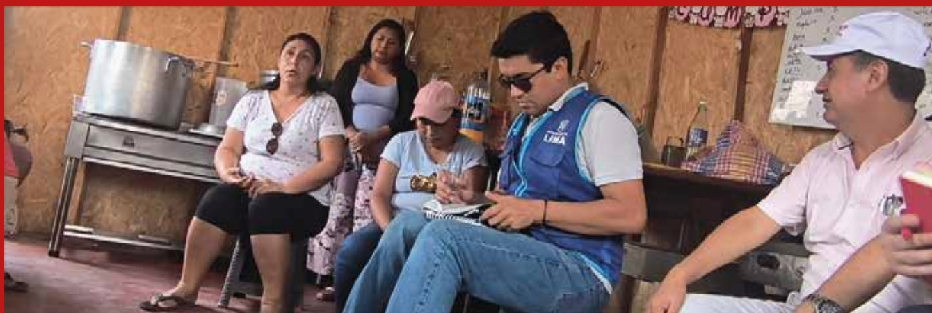
Por la salud y la calidad de vida. Equipo de la FMH-USMP capacitando a las integrantes de las "Ollas comunes".

Con el desarrollo del proyecto, la FMH-USMP contribuye, de forma decisiva, a mejorar la calidad de vida de los sectores menos favorecidos.