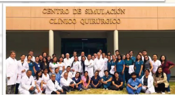
Centro de Simulación Clínico Quirúrgico